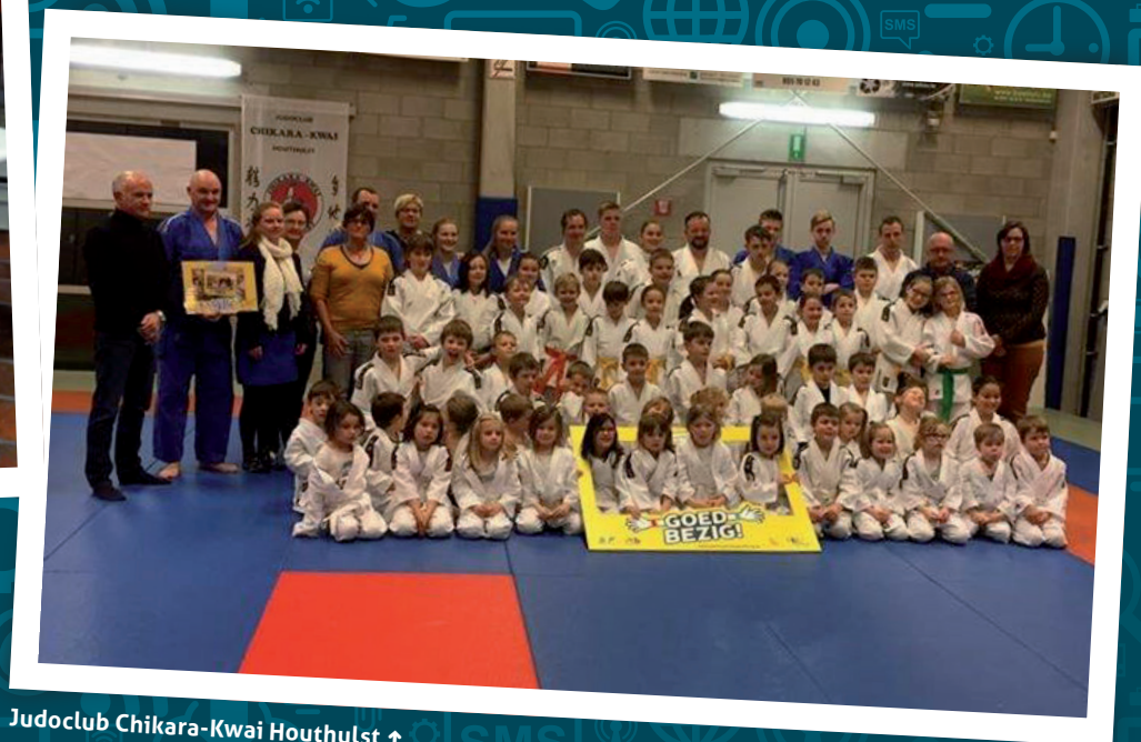
Judoclub Chikara-Kwai Houthulst ↑