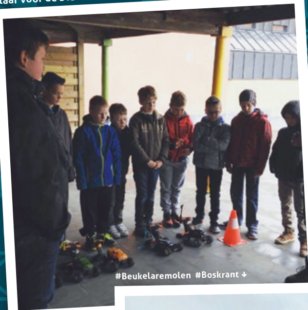
#Beukelaremolen #Boskrant ↓

Klaar voor de Stuntracers #Prikkel #Krok! #Boskrant ↓