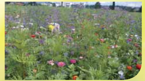
➤ De milieudienst voorziet de leefomgeving van groen.

De dienst verstrekt ook advies, begeleiding en zorgt voor de opvolging van projecten zoals natuurinrichting, landschapsbedrijfsplannen, groenaan-