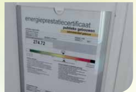
➤ Deze energieprestatiecertificaten herken je waarschijnlijk wel...

Wie milieu zegt, denkt ook aan energie! De dienst gaat op zoek naar energiebesparende maatregelen voor zowel de gemeente als voor de inwoners. Zo staan er groepsaankopen voor groene energie en zonnepanelen op stapel. Hiervoor is er een samenwerking met verschillende partners zoals Woonwinkel West, Eandis en de provincie West-Vlaanderen.