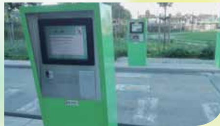
➤ Het recyclagepark van Houthulst werkt met een identiteitscontrole bij het binnenrijden.

Naast aarde, is water een volgend natuurelement waar we veel mee te maken krijgen. De milieudienst ontfermt zich ook over wateroverlast. Specifiek concentreren wij ons op de problematiek van wateroverlast met bodemerosie tot gevolg. We helpen mee aan projecten rond riolering, waterzuivering, afkoppeling en premies voor afkoppeling.