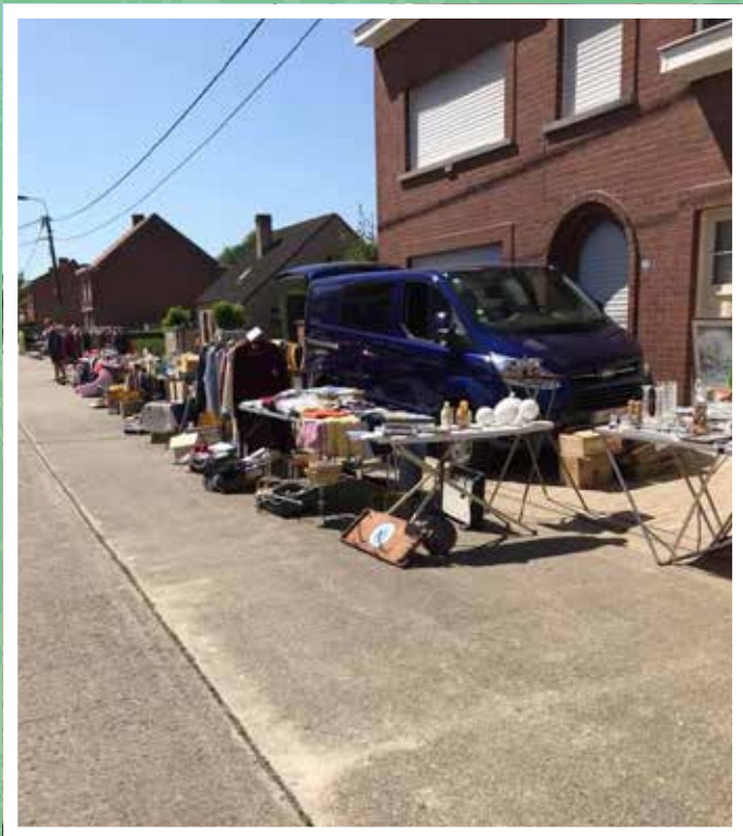
Rommelmarkt in de Vijverstraat