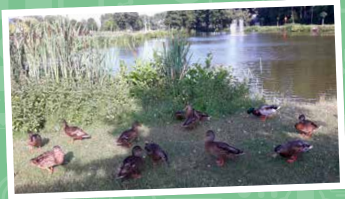
Eenden bij de Fabriekspuit

We tweeten, liken en delen foto's en updates over onze gemeente naar hartenlust. Deel je knapste foto uit onze gemeente via Facebook, Twitter of Instagram met #Boskrant of mail die naar communicatie@houthulst.be met onderwerp 'Foto Boskrant'. Wie weet komt jouw foto hier binnenkort op deze pagina!