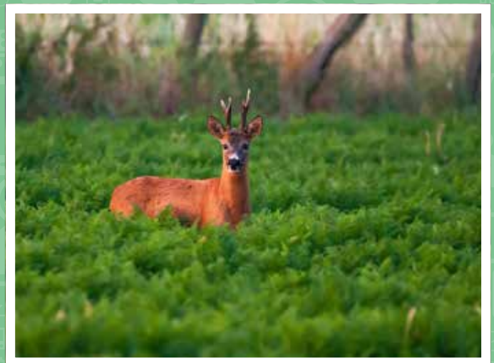
Herten gespot in het Vrijbos