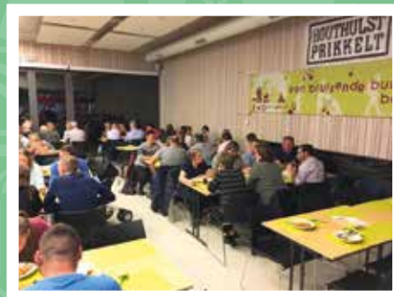
Café Mangé van KWB Klerken