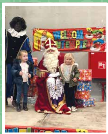
Bij de Sint in Houthulst