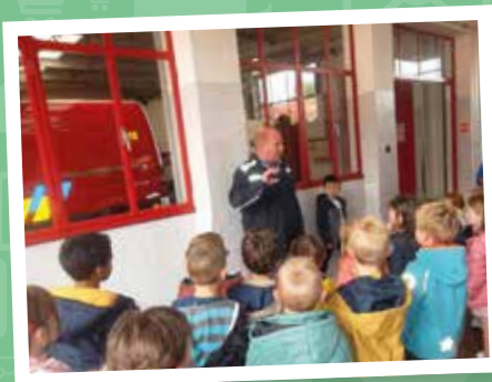
Kleuters bij de brandweer

We tweeten, liken en delen foto's en updates over onze gemeente naar hartenlust. Deel je knapste foto uit onze gemeente via Facebook, Twitter of Instagram met #Boskrant of mail die naar communicatie@houthulst.be met onderwerp 'Foto Boskrant'. Wie weet komt jouw foto hier binnenkort op deze pagina!