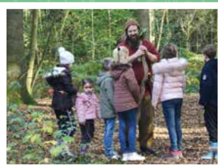
Druide in het Vrijbos