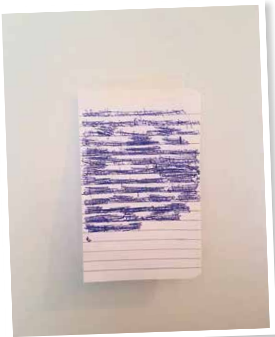
Gedicht: "Geheim" van een scholier uit Houthulst

→ De making off van Iedereen Dichter is te zien op www.iedereendichter.be .