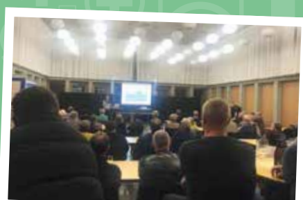
Lezing De wederopbouw van Merkem