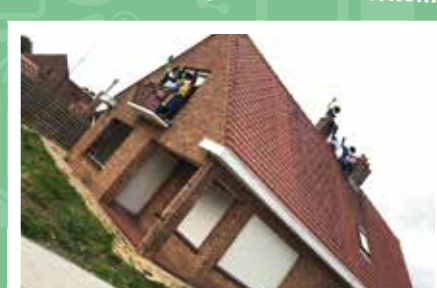
Sint-intocht in Houthulst