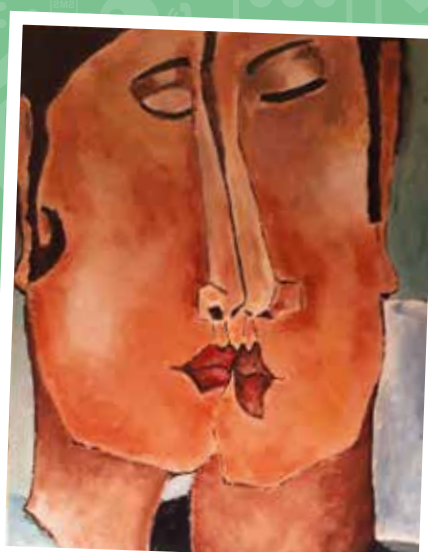
Buren bij kunstenaars