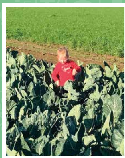
Een kindje in de bloemkolen