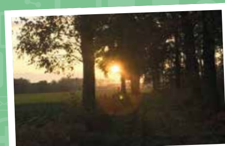
Herfstwandeling in Houthulst