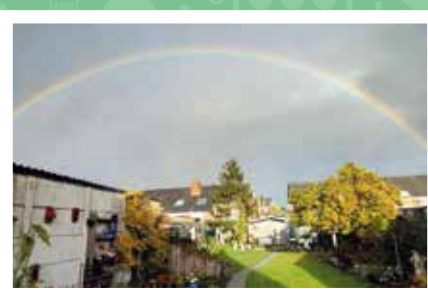
Regenboog in Klerken