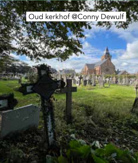
Oud kerkhof