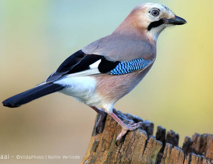
Gaai - ©VildaPhoto | Rollin Verlinde