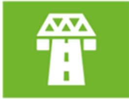
ruimte en infrastructuur