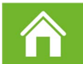
wonen en woonomgeving