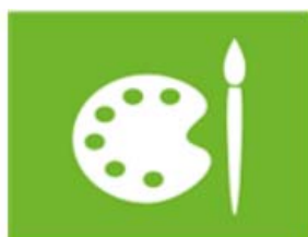
cultuur en vrije tijd