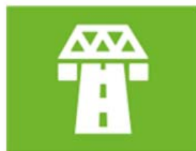
ruimte en infrastructuur