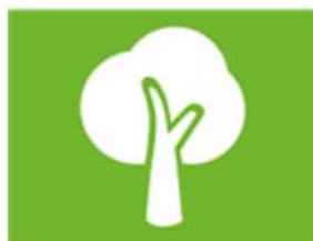
natuur, milieu en energie