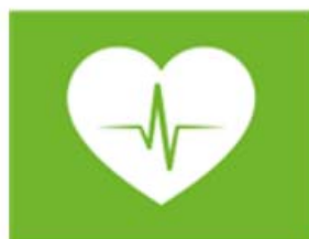
zorg en gezondheid