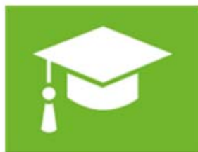
onderwijs en vorming