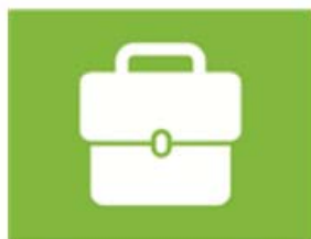
ondernemen en werken